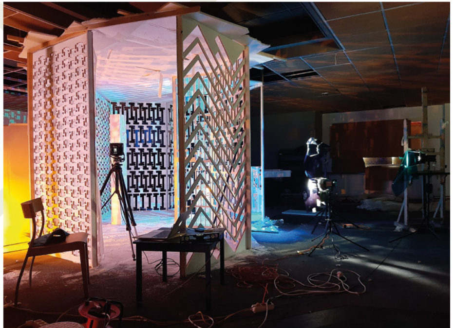
Jan Theun van Rees, 'Ruimte'

Jan Theun richt zich in zijn werk op de perceptie van de ruimte om ons heen. Zo maakt hij foto's van ruimtes die doorgaans onopgemerkt blijven. 'Verborgene ruimtes' zoals hij ze noemt. Soms manipuleert hij met gordijnen en doeken de lichtinval in bestaande ruimtes en legt daarmee de aandacht op de ruimtelijke kwaliteiten. Andere keren bouwt hij de ruimte zelf. Die ruimtes worden nooit als ruimte of installatie geëxposeerd. De ruimtes bestaan dus enkel op het moment dat Jan Theun ze bouwt en de foto is het enige 'bewijs' dat de ruimte er ooit was.