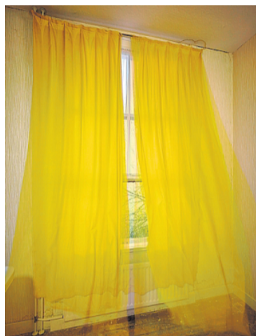
Jan Theun van Rees - Here nor there (2015)